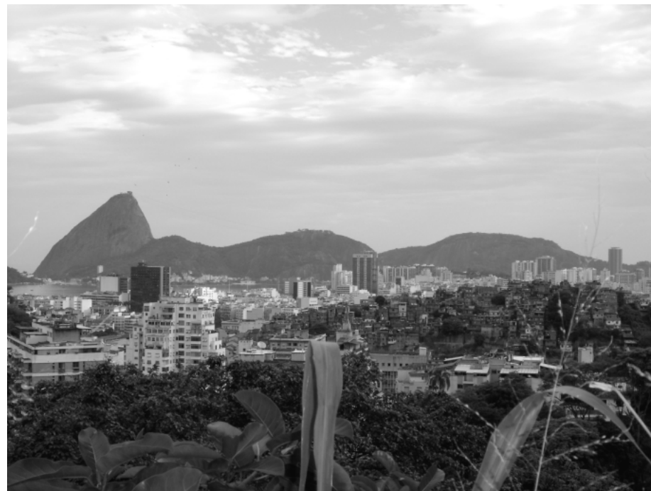
Rio de Janeiro : son pain de sucre et ses favelas

constructions. Le survol de Rio souligne une réalité : celle d'un pays où les paradoxes sont multiples. La richesse naturelle côtoie la pauvreté humaine.