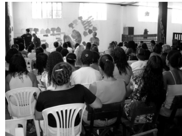
Evaluation annuelle - Novembre 2007