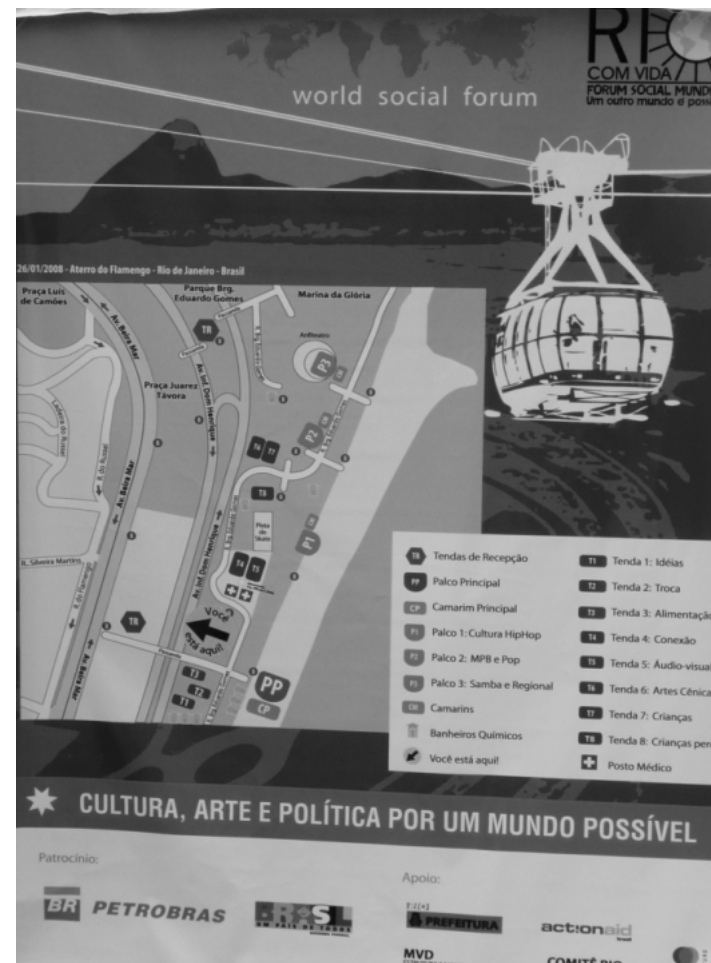
Journée d'action du FSM à Rio de Janeiro

15 personnes les plus proches, on ne pouvait pas entendre le contenu des discussions. Au final, les 10 000 participants annoncés par la presse brésilienne ont assisté à un événement qui ressemblait plus à une foire artisanale qu'à une journée d'action du FSM !!!!