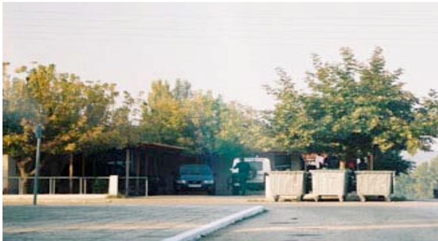
La station de police de Kiprinos.

les villages. Nous sommes donc arrivées à Kiprinos vers 17 heures. Nous avons décidé de chercher les rails mais le « camp » nous a surpris. Juste à côté de la mairie on a vu des grilles avec des vêtements accrochés dessus. On a reconnu l'image déjà vue à Peplos. Le centre de rétention cette fois-ci est dans la station de police du village et un policier était en train de laver sa voiture devant. (...)