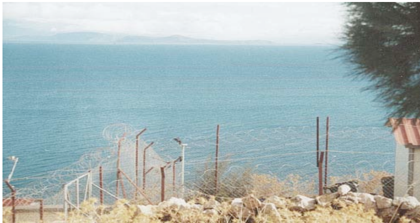
La vue depuis le centre de rétention à Chios.

Une autre différence : ici, jusqu'au mois de mai dernier, les détenuEs n'avaient pas droit de sortir mais le centre était ouvert pour toute personne qui voulait leur rendre visite . La situation a changée après une « révolte » des détenuEs : depuis les fenêtres du centre on aperçoit la mer et les internéEs ont ainsi pu voir des bateaux de la marine chasser et presque couler une petite barque avec des immigréEs. La révolte est venue en réaction.