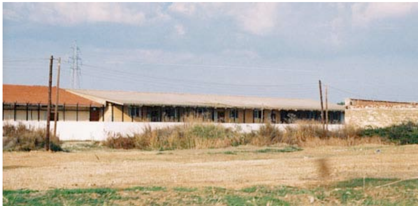
Le camp de Vena.

Nous y sommes restées à peu près une demi-heure en parlant avec les policiers et avec un Irakien qui était, quand nous sommes arrivées, le seul des détenus à être dehors ( il venait de compter les personnes enfermées pour que les policiers règle la quantité des repas à fournir). Nous avons appris qu'à ce moment précis, il y avait 120 hommes détenus. Et une seule femme. Il s'agissait d'une jeune fille qui venait d'être capturée pendant qu'elle marchait toute seule pas très loin du camp. Elle était assise toute seule, une canette de Coca à la main, à côté de l'entrée du bureau de policiers. Nous n'avons réussi qu'à échanger des regards.