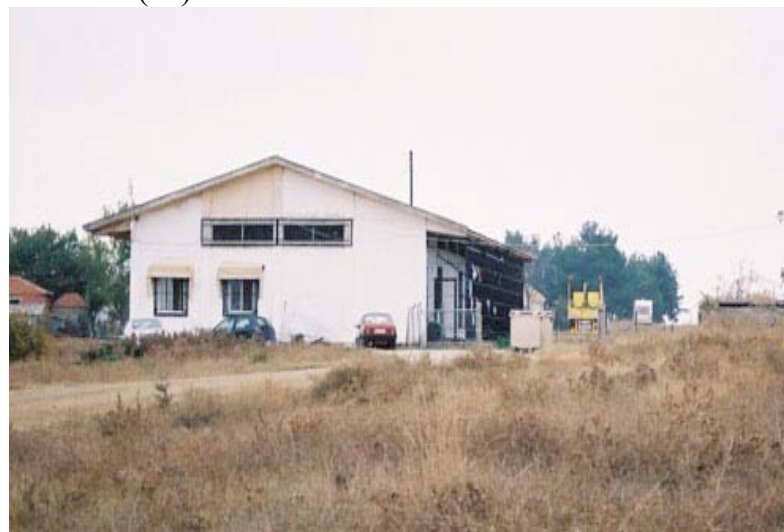
Le camp de Peplos.

pour s'y rendre. (...) Nous suivons ses conseils et, en chemin vers le village de Kipi, nous arrivons au premier camp de la région. J'ai eu à peine le temps de prendre une photo depuis la voiture en arrivant qu'un jeune « gardien des frontières » sort et nous fait signe de nous arrêter le plus loin possible. Nous sortons de la voiture et nous faisons encore quelques mètres à pied, il nous ne permet pas d'avancer, il est méfiant et distant. Juste derrière lui arrive un deuxième et nous essayons de poser de questions sans trop regarder le vieil et humide immeuble aux barreaux avec des vêtements, où des vêtements sèchent. (...)