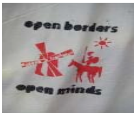
Open borders, Open minds, Affiche de l'action de Diktio devant l'Institut Cervantes peu après les événements de Ceuta et Melilla