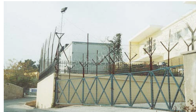
Le centre de rétention de Lesbos.

On ne garde pas beaucoup de personnes pour plus de deux mois. Les Afghanes ne restent qu'une semaine au maximum, les PalestinienNEs pas plus d'une dizaine de jours. Ceux et celles qui restent plus longtemps sont les IrakienNEs, les IranienNEs, les PakistanaisES et les ressortissants africainEs, afin de permettre aux autorités policières de contrôler leurs données personnelles auprès de leurs ambassades respectives. Une telle pratique va à l'encontre de toute notion de droit d'asile vu que les personnes qui sont « recherchées » chez elles, sont amenées à Athènes afin d'être expulsées au lieu d'être protégées par le statut de réfugiéE.