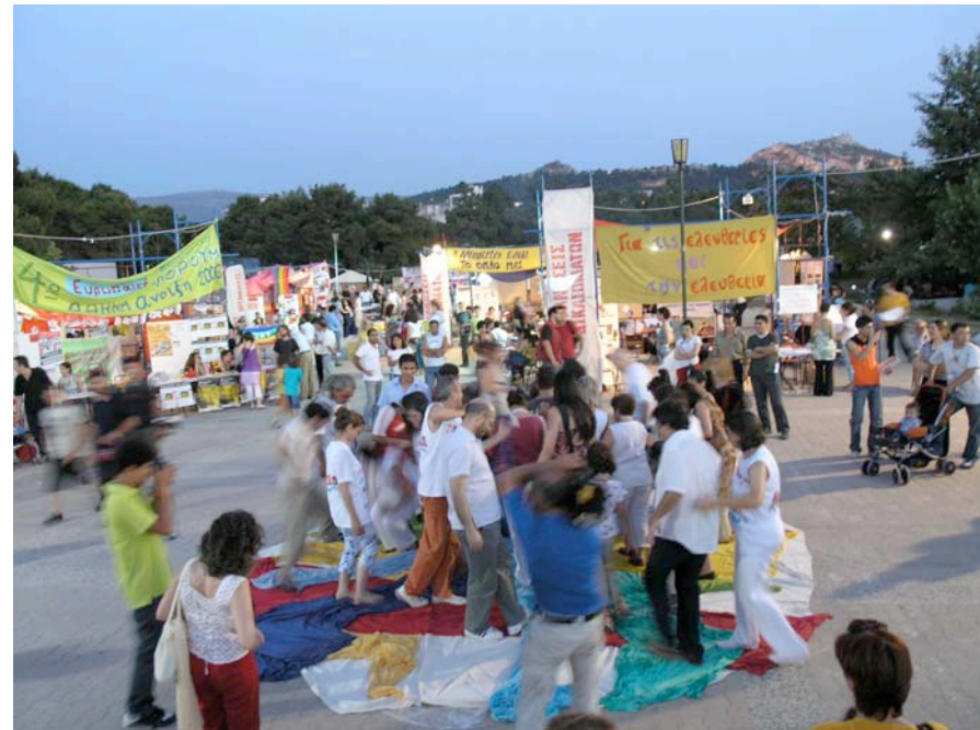
Pendant le Festival

Plus précisément, ces trois jours de débats ont porté, vendredi, sur le rôle de l'école et la place des élèves immigréEs, les relations entre les syndicats grecs et les travailleurs/ses étrangèrEs, les dix ans du Festival. Au menu de samedi, le prochain FSE, la Marche mondiale de femmes en Grèce, l'extrême droite, le nationalisme et le racisme en Grèce. Dimanche, les participants se sont attaqués à l'homophobie, évalué le commerce juste et équitable, réfléchi à la situation des réfugiés économiques et politiques en Grèce et à leur régularisation, le droit d'asile et l'égalité sociale.