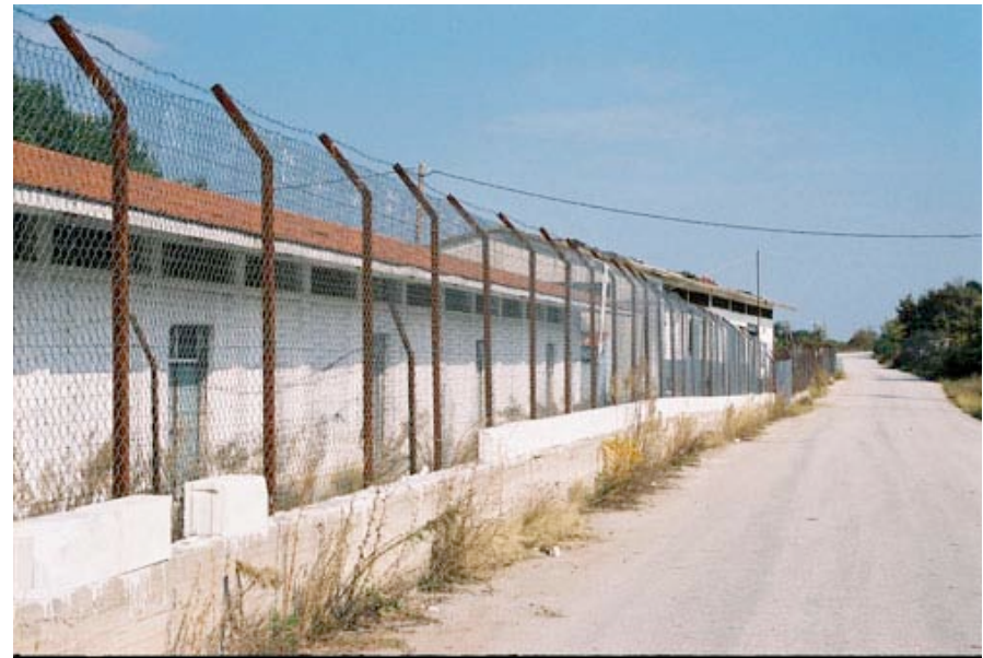
Le camp actuellement fermé de Dikaia.

(...) Nous avons décidé de faire un grand tour et d'aller d'abord encore plus au nord où, selon les informations fournies à Diktio par les autorités politiques locales un an plus tôt, il y a un très grand camp. A 15 heures nous sommes arrivées à Dikéa, un village à deux pas de la Bulgarie, au bord de l'Evros. A cent mètres de la gare ferroviaire et juste à côté des rails nous avons trouvé un énorme entrepôt, séparé en trois grands espaces. Les murs étaient couverts avec des slogans en anglais et en arabe et tout l'immeuble était aussi entouré d'une clôture de barbelés. Le camp n'est plus utilisé, il est vide et fermé mais toujours prêt à recevoir de personnes dans le cas de détentions massives. (...)