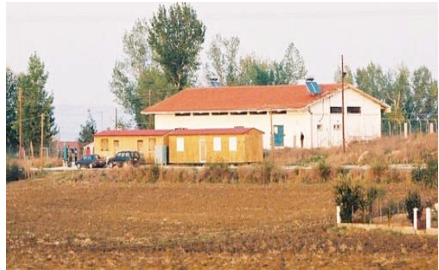
Le camp de Vrissika

l'entrée du village. Il s'agit d'un vieil et grand immeuble avec deux grandes portes et de très petites fenêtres fermées, entouré par des fils de barbelé. Le plus choquant est l'image d'une centaine de personnes (des hommes, vraisemblablement d'origine afghane et pakistanaise) parqués entre l'immeuble et le grillage, ne faisant rien, si ce n'est « profiter » du moment, du droit d'être hors les murs, sous le soleil. Deux grandes voitures policières bloquaient l'entrée, un policier de la police nationale et quatre de la police frontalière montaient la garde. Juste à côté, deux petites constructions en bois servaient de baraque pour les policiers. (...) Nous avons beaucoup parlé <avec les policiers> et nous avons obtenu des informations mais pas le permis de parler avec les hommes enfermés. Ils nous regardaient derrière la clôture de barbelés sans bien comprendre et sans beaucoup de réactions jusqu'au moment où nous sommes éloignées des gardes pour regagner la voiture. Ils ont alors commencé à nous parler en disant « good morning » ou « sorry » et même des salutations en grec. Nous avons répondu en grec et en anglais en disant que c'est nous qui étions « sorry ».