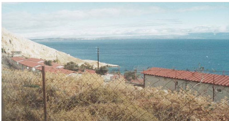
Le centre de rétention de Chios.